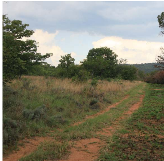
Die groen uitloopsels na 'n brand lyk miskien mooi, maar dit is nie so voedsaam soos gesonde veld nie.

Dongas is nie erosie nie. Dit is bloot die grafiese aanklag teen die mens oor skreiende en volgehoue pligsversuim – dikwels die sondes van die vaders wat die kinders besoek.