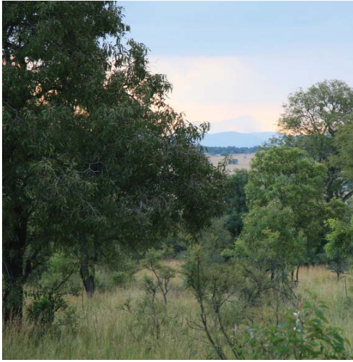
Gesonde weiding in die Bosveldstreek bied 'n kombinasie van gras en blare.

lewensmoontlikhede bo-op die grond nie, maar ook binne-in die grond deurdat die organiese materiaal wat as grondkometers dien, stelselmatig verdwyn en saam daarmee die mikro-organismes binne-in die grond. Dan stort die grondstruktuur in duie met gevolglike verdere verdigting deur die aanslag van son, wind, water en hoof.