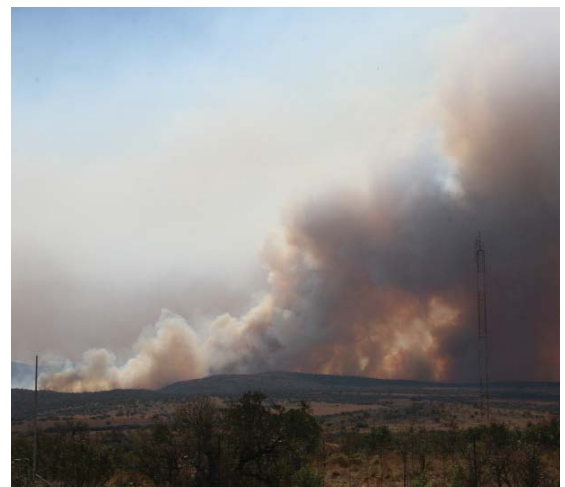
Veld kan jare neem om te herstel na brande, want dit is baie meer as net gras wat brand.

Erosie word eerstens veroorsaak deur die blootstelling van die grond aan die direkte vernietigende krag van son, wind